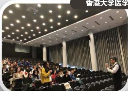
香港大学医学讲座