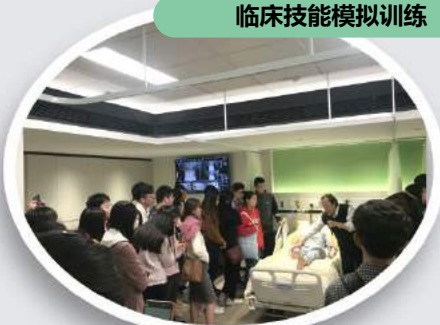
临床技能模拟训练