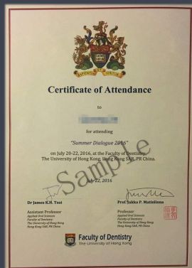
口腔专业医学生赴香港访学交流项目证书样本