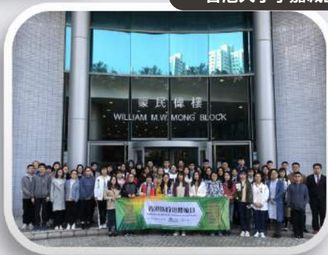
香港大学李嘉诚医学院参观