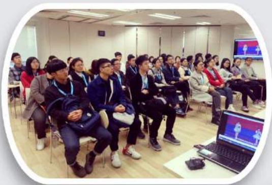
游览香港科技大学