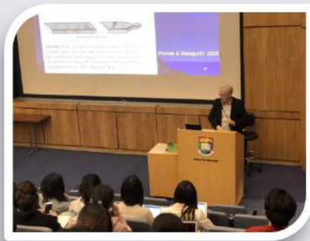
香港大学牙医学院 专家讲座