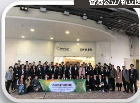
香港公立/私立医院参观